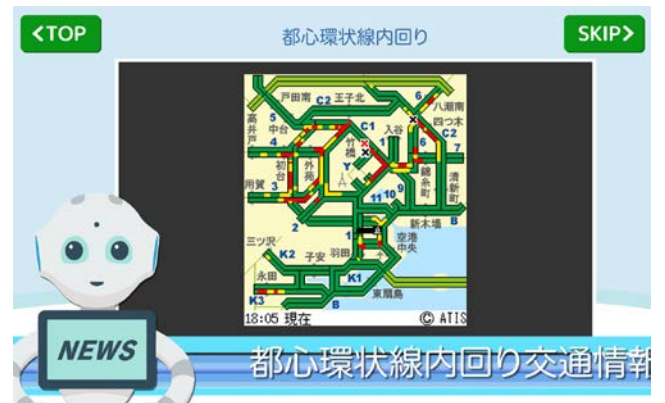
<交通情報を表示し、「Pepper」が音声で案内>