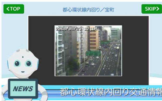
<ライブ交通映像で、混雑状況を確認>