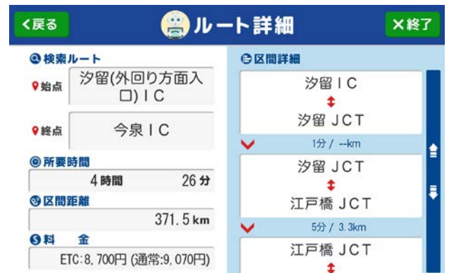
<時間・距離・料金別のルート検索>