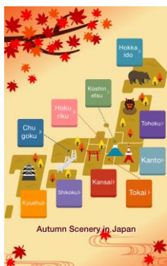
<都道府県選択・「紅葉名所」紹介>