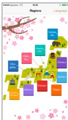
<都道府県選択・「桜名所」紹介>

ATISは、スマートフォン・フィーチャーフォン向け情報サービス『ATIS交通情報』、『レジャー&駐車場情報』を中心に、春には『にっぽん桜絶景』、秋には『にっぽん秋景色』(仮称・平成27年秋配信開始予定)など、人々の「おでかけ」をもっと便利にもっと楽しくする情報サービスをお届けしてまいります。