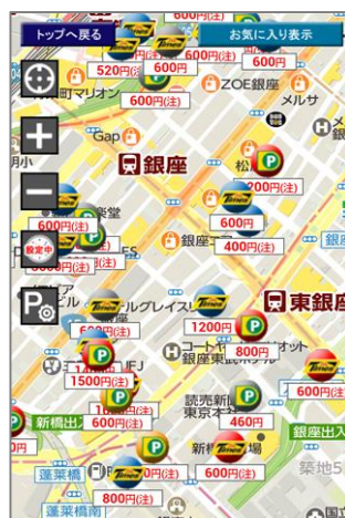
<駐車場満車・空車情報 画面>