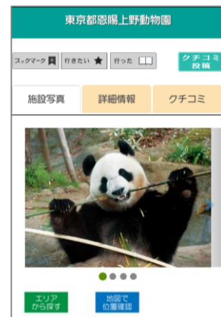
<レジャー情報 画面>