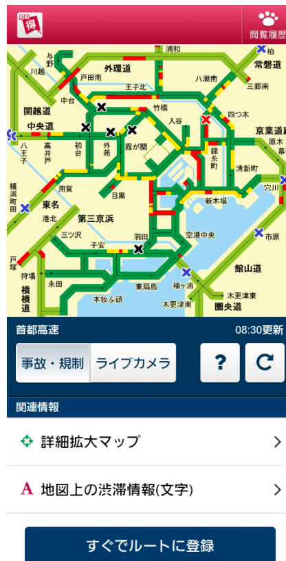
渋滞情報(マップ)コーナーTOP画像